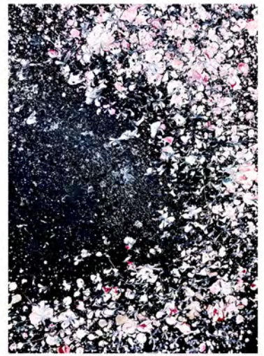
No.1696 【桜河-Ouka-】 2024年 380×269 アクリル、紙

この4つのテーマをコンセプトにこれまで3,436枚の作品を描き続け、日々新しい作品を生み出しています。 観る人に、夢を追い、困難に立ち向かう勇気を与え、孤独を埋める心の居場所となる作品を描きたいという 熱い想いが彼を日々キャンバスに向かわせます。大胆な構図と繊細な描写。時にたおやかに、時に力強く、 ドロッピング等の技法を駆使し、鮮やかで美しく幻想的な世界へと観る者を誘います。